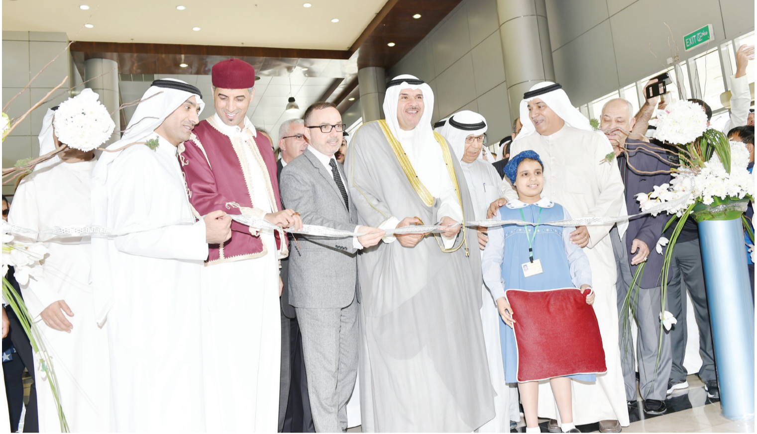
وزير الإعلام وزير الدولة لشؤون الشباب الشيخ سلمان الحمود يفتتح معرض الكويت للكتاب بحضور اليوحة والعنزي وسفير فرنسا والقائم بأعمال السفارة الليبية

جابر المبارك في افتتاح معرض الكويت للكتاب ونرحب بأصحاب السعادة السفراء والإخوة من الدول العربية ودول العالم وأصحاب دور النشر لوجودهم في بلدهم الثاني الكويت. وأضاف الحمود: يهدف المعرض بالدرجة الأولى إلى تعزيز دور الثقافة والعلم والقراءة في عالمنا العربي، وتحقيق التوازن الثقافي والحضاري والإنساني مع العالم.. وبالأمر القريب احتفلت الكويت أيضاً وبرعاية سامية وحضور صاحب السمو الأمير الشيخ صباح الأحمد الجابر الصباح افتتاح صرح ثقافي كبير هو مركز الشيخ جابر الأحمد الثقافي الذي يعد تحفة ثقافية ومعمارية عظيمة، ومجموعة من الجواهر لإشعاع الثقافة والتنوير وبث المعرفة والتواصل مع الحضارات والعالم.