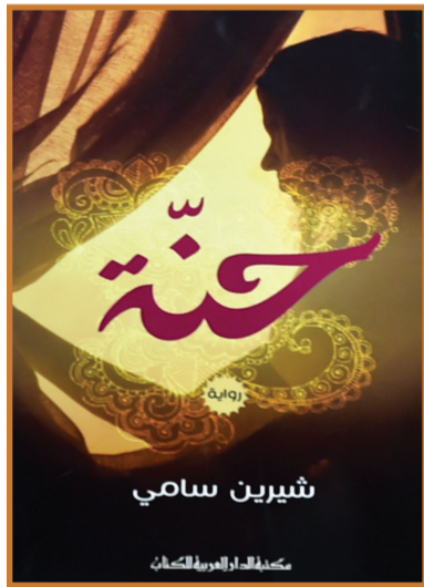
حنة (رواية) الناشر: مكتبة الدار العربية للكتاب المؤلف: شيرين سامي

روح الشرائع مؤلف واسع ومتشعب. وعلى الرغم من صعوبة الولوج إليه والغموض فيه، إلا أنه يلاحظ عند قراءته أن هناك فكرة واحدة واضحة تسير بالقارئ من الصفحة الأولى إلى النهاية، ألا وهي: «إن القوانين تنشأ حتماً من طبيعة الأشياء وتصلق رويداً». يتخصص الجزء الثاني من روح الشرائع في البحث في قوانين التجارة وعلاقتها بالحكومات والشعوب وكيفية إنشاء المؤسسات الخاصة بها. ويركز أيضاً على حرية التجارة، وقانون رودوس، وتجارة طبقة الأشراف في الملكية ليخرج في نهاية المطاف بأطروحة متكاملة مع الجزء الأول، يمكنها أن تكون أساساً لروح الشرائع.