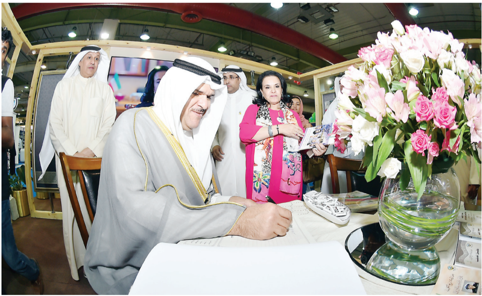
وزير الإعلام وزير الدولة لشؤون الشباب الشيخ سلمان الحمود يوقع كلمة في جناح مكتب الشهيد بحضور فاطمة الأمير

وتمنى الحمود أن يحقق المعرض أهدافه قائلا: نأمل من خلال وجود هذه الكوكبة من المثقفين والمعنيين بالشأن الثقافي ومن خلال دعمكم الكبير أن يحقق معرض الكتاب أهدافه خاصة أنه يشهد كل عام توسعا وإقبالا كبيرا من دور النشر ومن الدول العارضة المرحب بها في الكويت، ونأمل أن يكون المعرض تظاهرة ثقافية لما يشمله من أنشطة ثقافية مصاحبة تركز هذا العام على الشباب، وأهمية غرس الثقافة والمعرفة فيهم، كما تركز أيضا على تعزيز الهوية الوطنية في