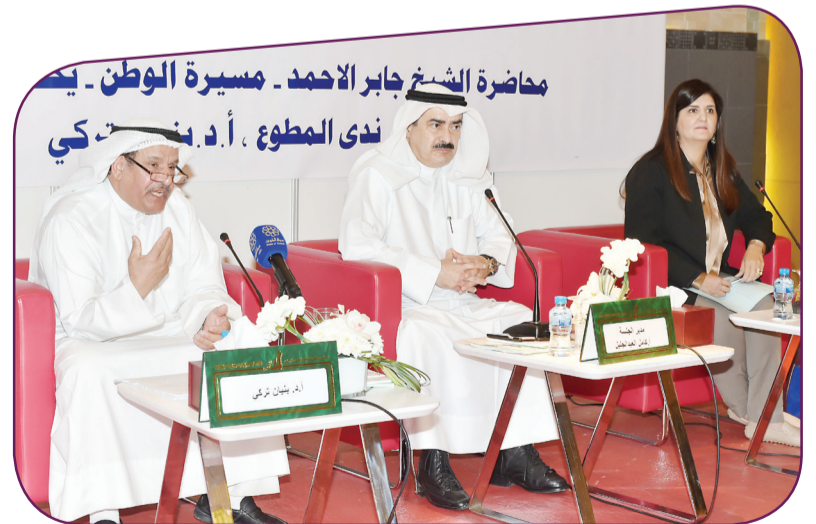
«جابر الأحمد..مسيرة وطن»