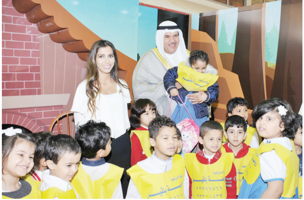
وزير الاعلام خلال زيارته لجناح «ثقافة الطفل»