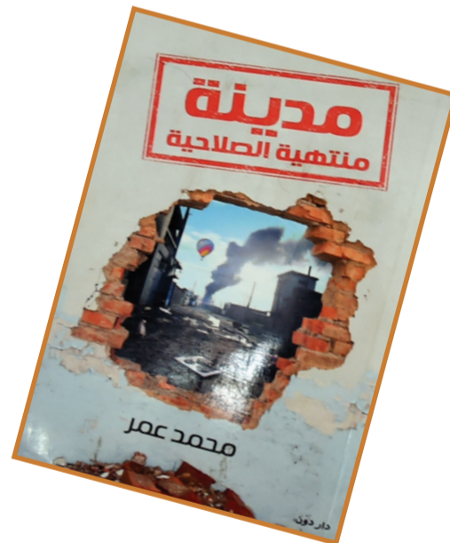
الناشر: دار دون المؤلف: محمد عمر

العاصمة كلها أصبحت في الشارع بعد أن انقطعت عنهم الأخبار، ظنا منها أن وجودها قد يحل شيئاً، طائرات الهليكوبتر التي تحوم حول سماء العاصمة كثيرة، وفي هذه الفوضى، وهذا الظلام كان تحديد الطائرة التي اختفت للحظات باتجاه القصر ورجعت للسماء مرة أخرى صعباً، قصاص ورق نزلت كالمطر على الناس، مكتوب فيها: «شكراً للريتويت، سأعتبر هذا تفويضاً لقتلكم جميعاً، انتظروا تفجيراً كل دقيقة».