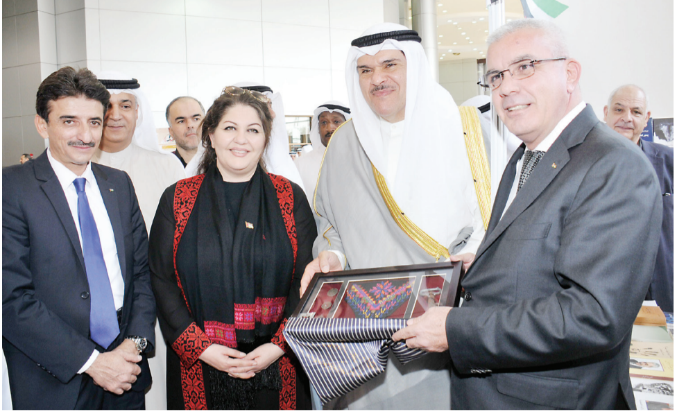
تكريم وزير الاعلام

وختم د. بهجت كلمته بأن المعرض يعد فرصة لتلاقي المثقفين، حيث يعتبر بمثابة عرس للثقافة.