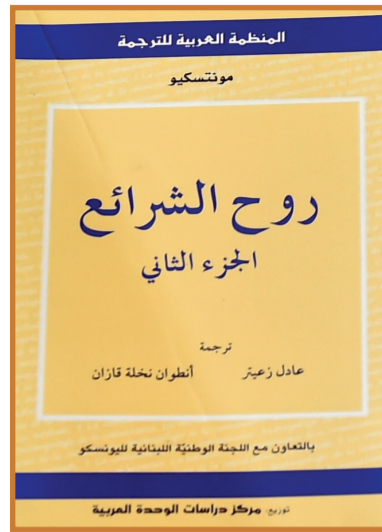
روح الشرائع (الجزء الثاني) الناشر: المنظمة العربية للترجمة المؤلف: مونتسكيو