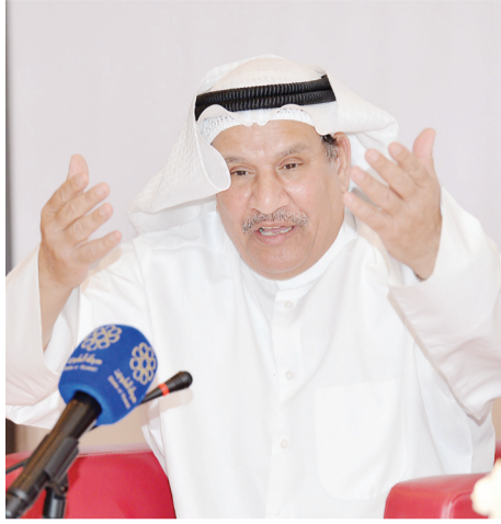
د. ببيان تري

واشارت المطوع إلى ابرز القمم الخليجية التي استضافتها الكويت والتي حملت فكر المغفور له الشيخ جابر الأحمد وهي القمة الخامسة للمجلس الأعلى لدول التعاون في عام 1984 م والتي شهد من خلالها اهل الخليج انطلاق صوت «أنا خليجي» عبر إذاعة وتلفزيون الكويت بالإضافة إلى ساعات البث الاخباري المشترك وقد تميزت هذه القمة بالبصمة الإعلامية والدبلوماسية الكويتية. وحكم الشيخ جابر الأحمد الجابر الصباح الكويت في الفترة من (1977 - 2006 م) وهو أمير دولة الكويت الثالث عشر والثالث بعد الاستقلال من المملكة المتحدة وهو الابن الثالث للشيخ أحمد الجابر الصباح.