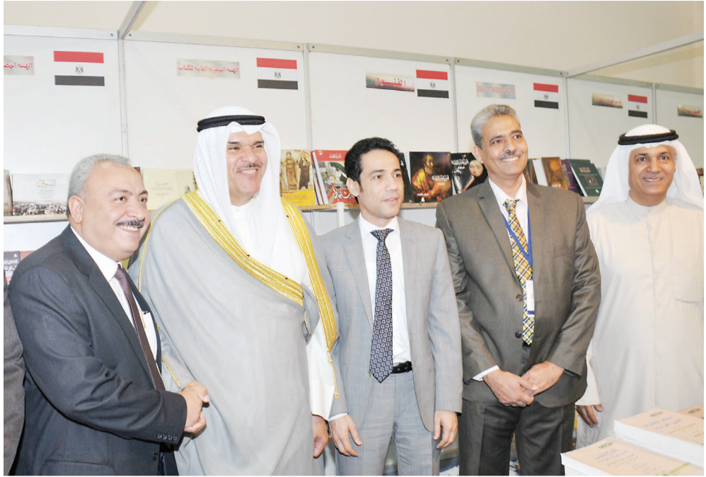
وزير الاعلام في الجناح المصري